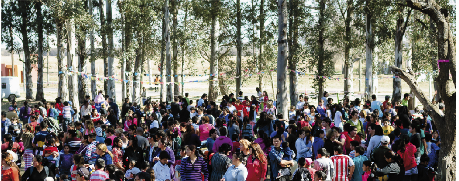
"Bosquecito: limpieza y recuperación de este lugar de esparcimiento"